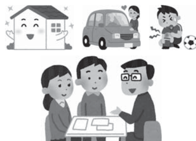
それぞれの保険に告知義務、通知義務の事項があります。

また、違反がわかれば、保険会社側から保険契約を解除することがありますので、正しい申告が必要です。